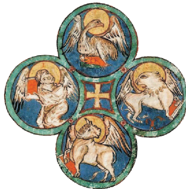
Formulare der Gottesdienste